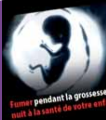
Fumer pendant la grossesse nuit à la santé de votre enfant

Mais saviez-vous que fumer va provoquer rapidement certains changements dans votre vie ?