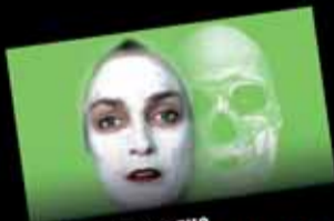
Fumer provoque un vieillissement de la peau