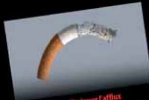
Fumer peut diminuer l'afflux sanguin et provoquer l'impuissance