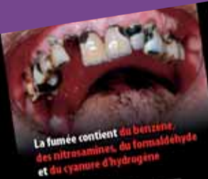
La fumée contient du benzène, des nitrosamines, du formaldéhyde et du cyanure d'hydrogène