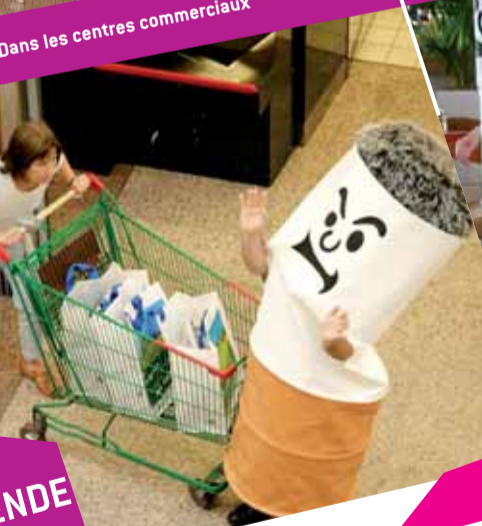
Dans les centres commerciaux