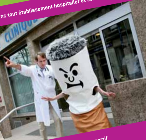
Dans tout établissement hospitalier et son enceinte