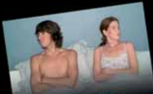
Fumer peut diminuer l'afflux sanguin et provoquer l'impuissance