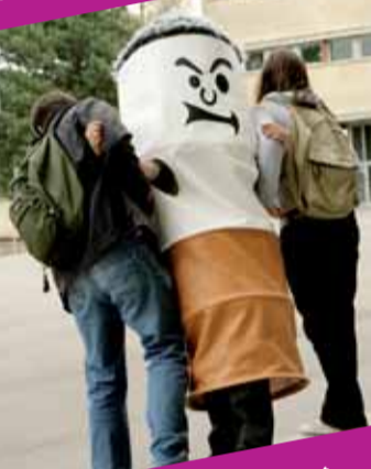
Dans tout établissement scolaire et son enceinte