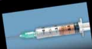
Fumer crée une forte dépendance, ne commencez pas