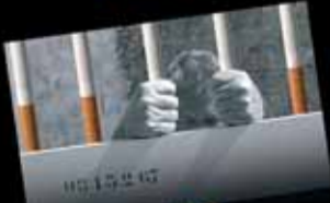
Fumer crée une forte dépendance, ne commencez pas