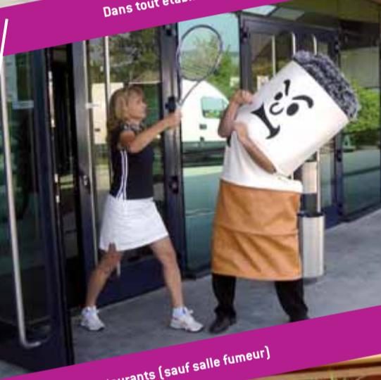
Dans tout établissement sportif