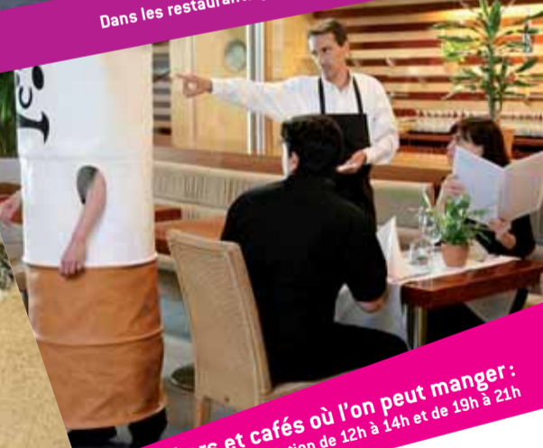
Dans les bars et cafés où l'on peut manger : interdiction de 12h à 14h et de 19h à 21h