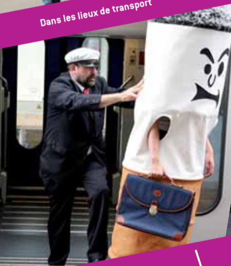
Dans les lieux de transport