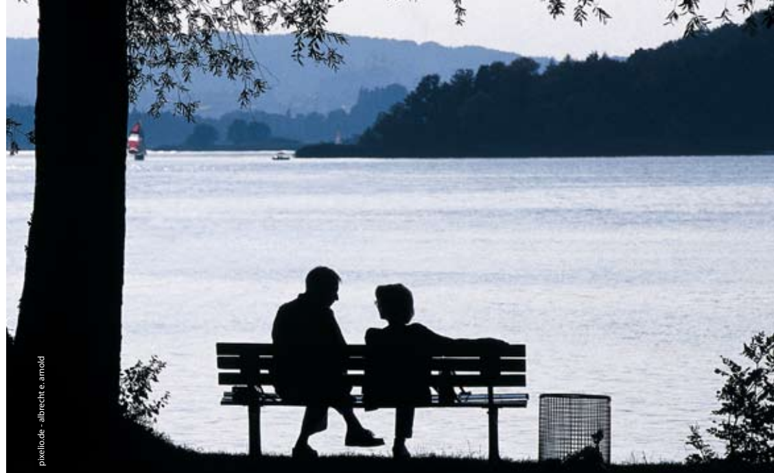
pixelto.de - albrecht e. amold

Wir organisieren regelmässig Konferenzen und Expertenabende, die in der Zeitschrift „Info-Cancer“ sowie im Newsletter bekannt gegeben werden.